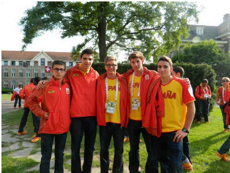
2 atletes i 3 nedadors, tots 5 de Sabadell.

Per últim, mencionar que de Sabadell hi havia 5 representants en aquest Campionat.