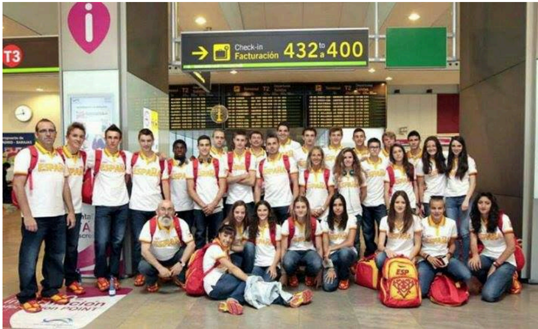
La Selecció espanyola a Madrid, a punt de volar a Amsterdam.

El dia abans havia rodat 20 minuts amb l'Alexis fent alguns progressius i em notava perfecte, el Jordi, corria el dia 16, dimarts a les 16 de la tarda, l'hora més calorosa del dia però per sort Holanda no fa tanta calor com aquí el Mediterrani. A les 15h a escalfar rodant amb nervis però controlats, estiraments, progressius, i... a cambra!! Vam estar-hi força estona aquí, cosa que fa posar més nerviós, entrem a pista, i ens presenten als 3 que tenim la millor marca! Però no hi ha pressió. Em col·loco 4-5 i el primer 1000 és lent, 2'55, em quedo en aquesta posició i a mitja cursa el ritme canvia i passem el 2000 en 5'48, (2'53 l'últim 1000). A falta de 700 metres encara estic 5è i el portuguès canvia, jo a falta de 500 intento passar al suís per fora i això em fa gastar forces, passo a meta 3è però em trobo molt "agarrotat" a falta de 250 metres i em passa el turc, finalment també em passa el suís i quedo 5è, amb un temps de 8'36"17, resultat agredolç però em puc donar per satisfet.