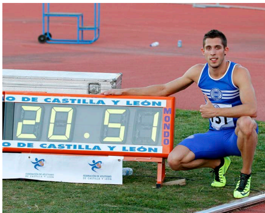
"Meeting" de Salamanca

Sincerament no comptava, perquè l'any passat volia centrar-me més en el 100, no volia fer tants 200, però vaig córrer en 20"82 a la pista de Serrahima i vaig dir-me," que ha passat?"; després vaig fer 20"73 i no donava crèdit al que estava passant. A l'anar a Salamanca sabia que podia córrer més, ja que sempre que he anat allà, he fet marca de la temporada o de les millors, tota la gent de la concentració i els responsables creien que faria rècord, i de tant que m'ho deia la gent, vaig pensar, per què no?, encara que no volia fer-me il·lusions perquè sabia que era rebaixar molt la meva marca personal feta 4 dies abans, però vaig sortir amb força i creient que podia, i finalment va sortir.