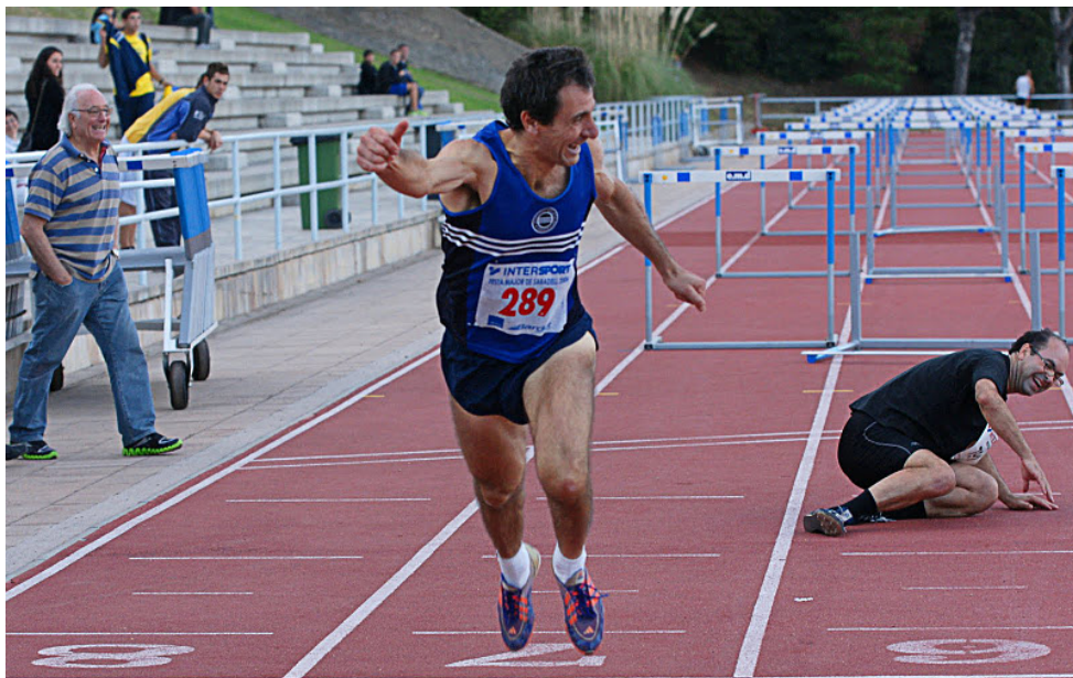
Campionat de Sabadell 2011 (1 o - 110 m.t. - Campió als 50 anys)

TOTAL : 345 competicions / 1.185 actuacions (marques)