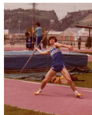
Campionats del Vallès (Granollers 1980)

2011: Categoria veterà M45 / A partir 28 juliol M50