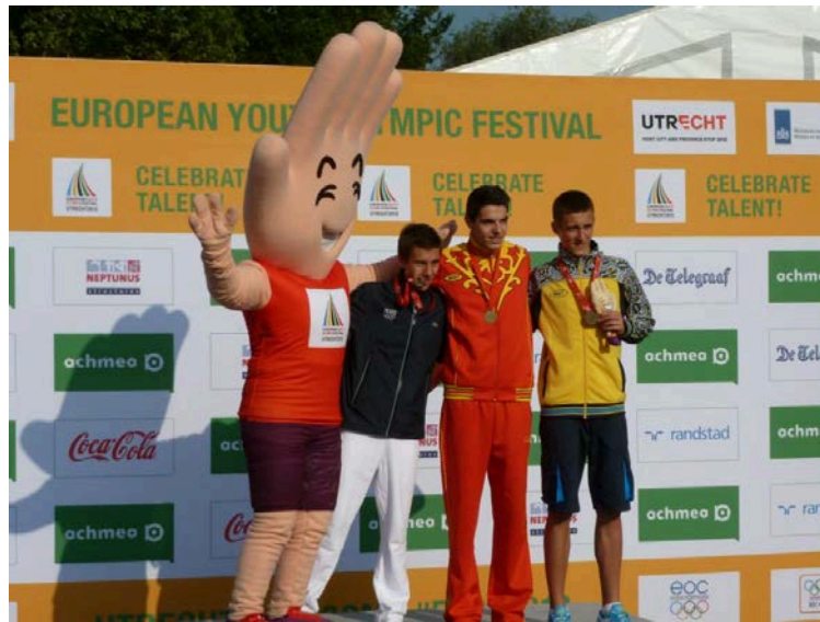
Podi dels 2000 metres obstacles.

Abans d'acabar, vull donar-li les gràcies a tothom que va fer possible que participés a la FOJE, en especial al meu gran grup d'entrenament, als meus pares, al Ramon i tots els altres companys de club i sobretot a la persona que m'ha portat fins aquí, el pare atlètic, el Pep!