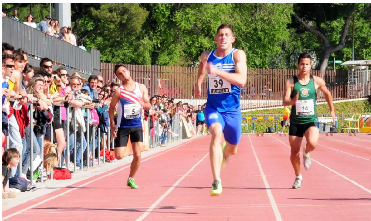
Final 100 m. Cnat Catalunya Clubs 2013 (Serrahima-Barcelona)

Aquella època va ser molt estranya, perquè vaig millorar molt la meva marca de 200 i de 100, i per això vaig poder anar al Campionat d'Europa sub 23 i poder competir en un nivell bastant bo als Campionats d'Espanya Absolut, i dic que va ser molt estranya perquè va ser una temporada on no tenia entrenador, vaig deixar l'anterior i vaig entrenar durant tota la temporada sol i amb el meu pare. Tot i així va ser en aquesta temporada quan vaig fer un salt qualitatiu, ja que m'havia quedat molt estancat en 100 i 200, amb 11 pelats i 22 pelats.