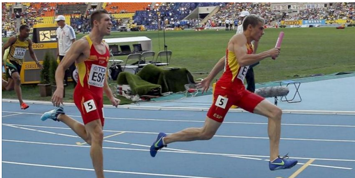
Semifinal 4x100 Campionat del Món (Moscou – Agost 2013)

Doncs, no se si sóc capaç de fer-lo, però aquest any es veurà, crec que sí que puc, hem centraré aquest any en el 60 durant la pista coberta, i si em va bé, hem centraré en els 100 metres. Aquest any hi ha Europeu i crec que és l'any d'aprofitar i veure fins on puc arribar al 100; jo crec que si no em faig mal puc fer el rècord, però és possible que no sigui capaç, una cosa es el que jo crec, i altre és el que puc fer.