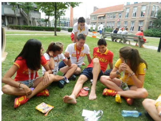
Alguns companys a la "Vila"