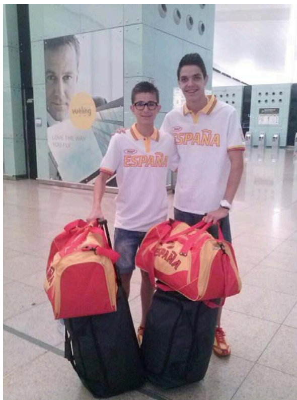
Aeroport de Barcelona, preparats per viure una gran experiència.

Holanda, concretament la ciutat d’Utrecht, va acollir el 11è Festival Olímpic, del 14 al 19 de Juliol.